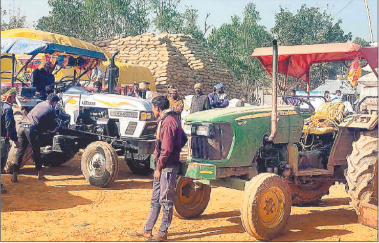
खरीदी केंद्र में अपनी बारी आने का इंतजार करते किसान।

सहकारी समितियों में अपनी उपज बेचने हर दिन बड़ी संख्या में किसान पहुंच रहे हैं। रबी फसल की बनाई करने के पूर्व किसान अपनी उपज जल्द बेचने की कोशिश कर रहे हैं। सहकारी समितियों द्वारा भी खरीदी तेज कर दी गई है। प्रारंभ में धान की खरीदी धीमी रफ्तार से चल रही थी लेकिन अब जमकर खरीदी हो रही है तथा समितियों में धान का अंबार लगा गया है। समिति प्रबंधक परेशानी को देखते हुए लगातार धान उठाव मांग कर रहे हैं। जिला सहकारी केंद्रीय बैंक प्रबंधक की स्थिति से अवगत कराने के साथ ही प्रबंधक प्रशासनिक अधिकारियों को भी धान का उठाव कराने ज्ञापन सौंप रहे हैं लेकिन स्थिति में कोई बदलाव नहीं आ सका है। कई उपार्जन केंद्रों में बफर लिमिट से दो गुना से भी अधिक धान जमा हो गया है। इधर विपणन संघ ने राइस मिलरों को धान उठाव का डीओ