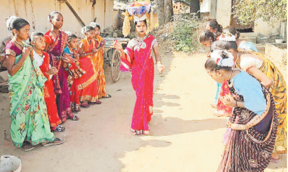
सुवा नृत्य करती युवतियां।

इन दिनों ग्रामीण क्षेत्रों में सुआ, शैला नृत्य की धूम मची है। खेती किसानों का काम समाप्त हो जाने पर ग्रामीण नई धान फसल की कटाई के उपलक्ष्य में हर्षोल्लास और सांस्कृतिक गर्व के साथ यह उत्सव मना रहे हैं। मनोरंजन के लिए एक दूसरे के गांव में टोली में पहुंच मनमोहक नृत्य प्रस्तुत करते हैं। परंपरासुरा ग्रामीण गांव में पहुंचे टोली को धान, चावल एवं सथासंभव राशि देकर सम्मानित करते हैं। इस तरह के आयोजन से जिले के गांव में उत्साह का माहौल है। जिले में सुआ शैला नृत्य की अपनी ही अलग पहचान है जो गांव में साल में एक ही बार जब खेती-किसानी का कार्य पूरा हो जाने के बाद