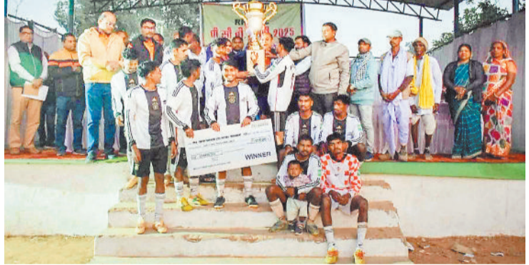
किया। विजेता साल्ही टीम को 61 हजार नकद राशि और पीसीबी ट्रॉफी प्रदान की गई, जबकि