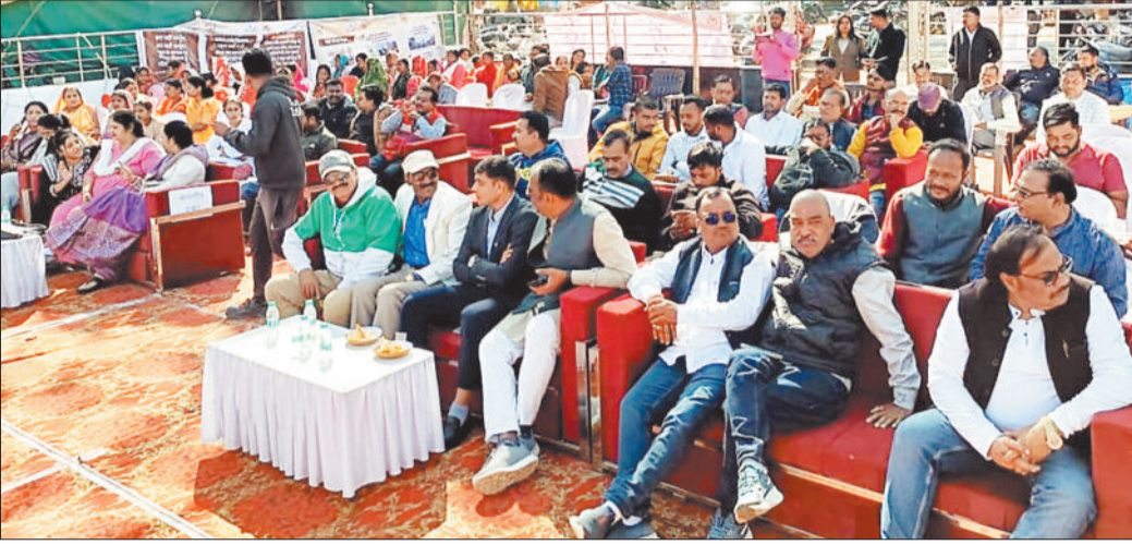
अटल परिसर में उपस्थित लोग।